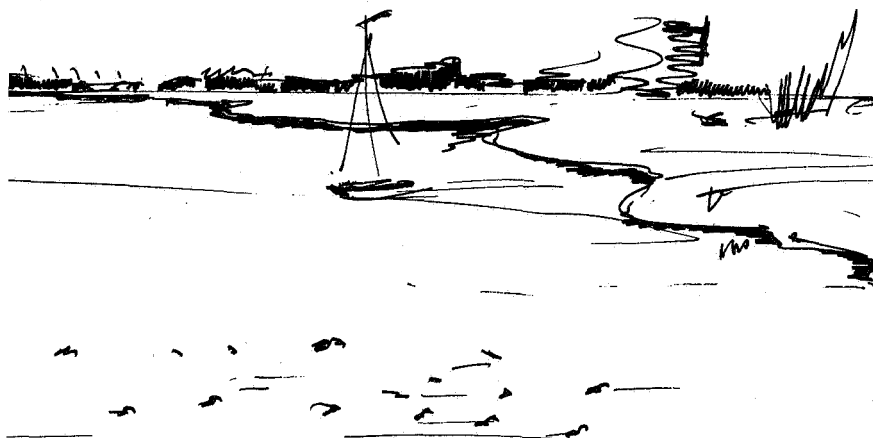
Kleine Wielen -