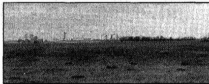
Op de achtergrond de Suikerfabriek

Het mocht allemaal niet helpen. Half november kregen de bezwaarden van GS een