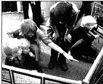
Voorlichting aan de jeugd

In het rapport 'IMP's als aangrijpingspunt voor voorlichting' worden ons een aantal ver-