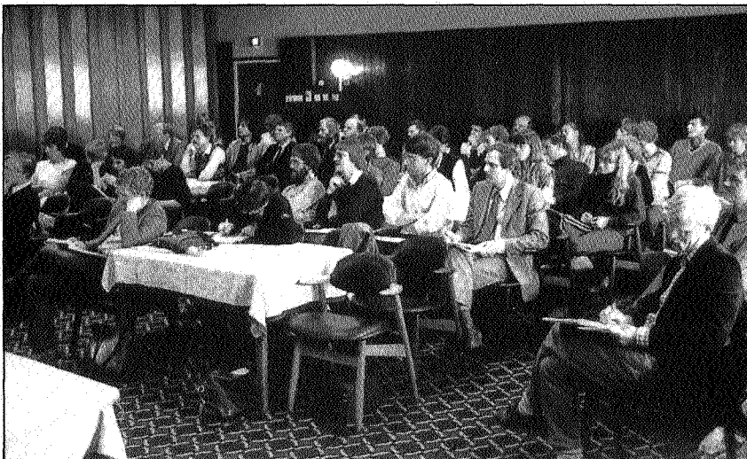
Voorlichting over IMP's

essentie niet worden gesjoemeld en dat dreigt te gebeuren wanneer allerlei doelgroepen moeten worden gespaard terwille van bepaald imago. Daar komt nog bij dat sommige milieuorganisaties intern verdeeld zijn over de vraag welk imago moet worden gerealiseerd: dat van de aktiepartij of dat van de overlegpartij (om maar twee varianten te noemen). Het kan, hoe dan ook, geen kwaad de vinger aan de pols te houden en periodiek op een eenvoudige manier na te gaan welk beeld de doelgroep heeft van de betrokken milieuorganisaties: dergelijke onderzoeken kunnen nuttige beleidssuggesties opleveren, de universiteiten zijn er goed voor.