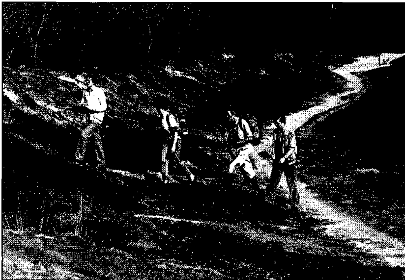
Wandelroute door de Bakkeveenster duinen