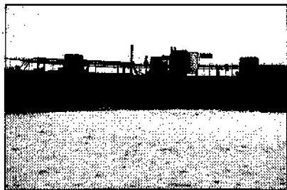
Lozen van boorspoeling op de Eems

De Werkgroep Eemsmond probeert bedreigingen van het Eems-Dollardgebied tegen te houden of te stoppen, want de overheid erkent de natuurlijke waarden van het waddengebied wel, maar beschermt ze in de praktijk niet afdoende.