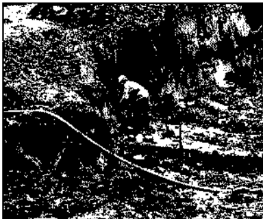
Tijdens het afgraven controleert een milieukundige of het 'front' van de verontreinigingen al bereikt is.

In januari 1987 heeft de sanering mede vanwege de vorst enkele weken stilgelegen. Die tijd werd benut met, zoals Boudewijn Luyken het uitdrukt, 'het maken van een bestuurlijke vertaling van de feiten en het voeren van discussies met GS'.