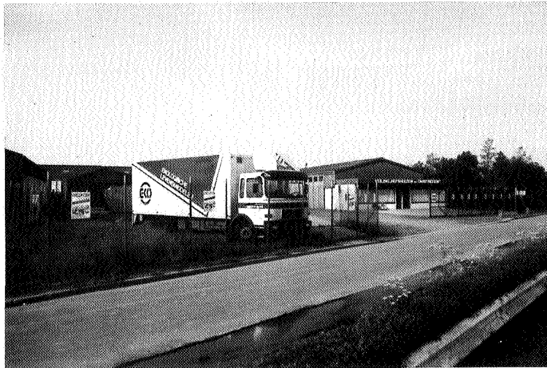
De gebouwen van de veiling Hefshuizen & Omstreken in Uithuizen.