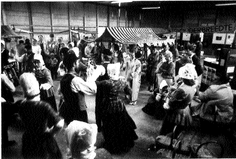
Naast veel praktische informatie, ook tijd voor cultuur: de Hogelandster Dansers op de biologische land- en tuinbouwbeurs in Uithuizen.