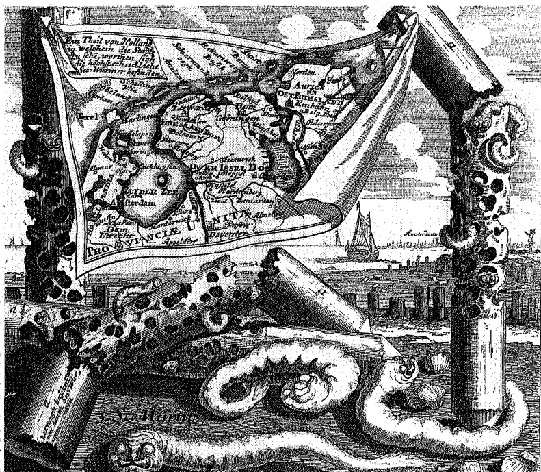
'Het gezegende Nederland of een gedeelte van dien verkeert in noodt van Overstrominge door een zeldzaam wormgeknauw'. Aldus Bernhardus van Gelder in 1724. De gravure is de visie van Elias Baeck uit 1732

pelijke waterlossing, waterleiding of waterloop, 't zij in het algemeen eene gemeenschappelijke wering, ophouding, afvoer of regeling van het binnenwater, een en ander door aanleg, verbetering of onderhoud van de voor die gronden noodig geachte en met het doel van het op te rigten waterschap in verband staande werken.' Veel partikuliere polders werden naderhand ondergebracht bij of omgezet in gereguleerde waterschappen. De vrij snel toegenomen taken van het provinciaal bestuur op het terrein van de waterstaat resulteerden in 1876 in de oprichting van de Provinciale Waterstaatsdienst van Friesland (PW). De instelling van PW viel aan het begin van een periode van ongekende activiteit op het terrein van de waterstaat. De dienst was naast het toezicht op de boezemwaterschappen en boezempeil ook betrokken bij de omvangrijke verbeteringen van de binnenlandse waterstaat tijdens de jaren rond 1880. Tevens hield PW toezicht op de verveningen en het uitvoeren van verbeteringen aan de zeedijken alsmede op sluis- en havenwerken en vaarwaters.