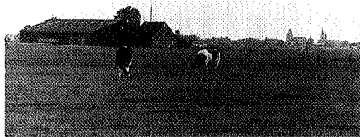
Dit behoort ook tot de mogelijkheden rond Bedum