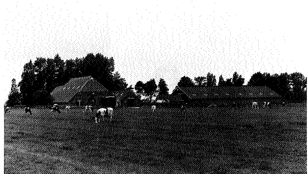
Schuren die onderdeel uitmaken van het landschap bij Bedum, foto Willem Friedrich