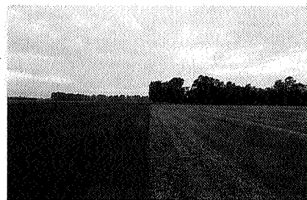
Messcherpe grenslijn tussen Nederland en Duitsland, foto Benno Neeleman