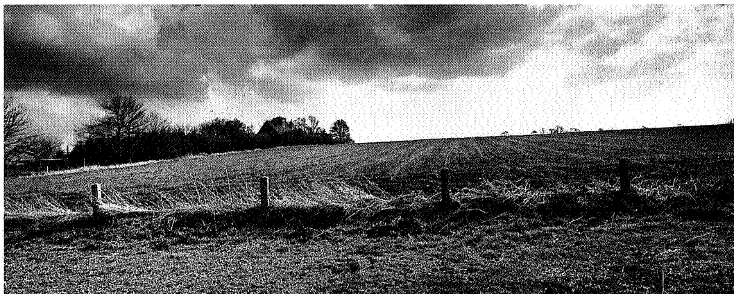
Hasseberg op de grens ter hoogte van Sellingen, foto Annette Lameijer