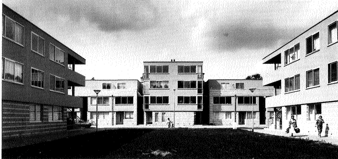
In het midden heeft de woonstraat een accent gekregen van een bebouwing die bestaat uit vier bouwlagen met aan de voorkant een plein

In de haakvormige bouwblokken zijn de hoeken op een bijzondere manier opgelost. Niet massief