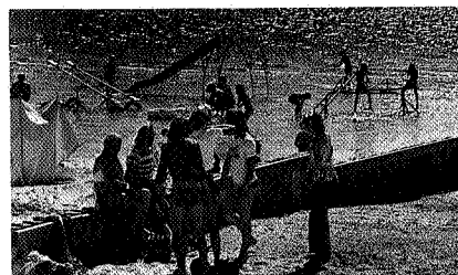
De Holle Poarte

In een volgend nummer wordt ingegaan op de problemen rond het gebied bij Workum en Hindeloopen. ■