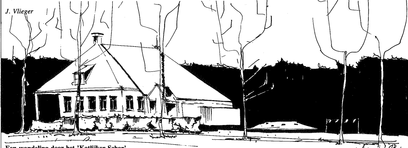
Een wandeling door het 'Katlijker Schar'

H et 'Katlijker Schar' is eigendom van de Provinciale Vereniging voor Natuurbescherming 'It Fryske Gea'. In 1969 kocht de vereniging dit landgoed, dat gelegen is in de gemeente Heerenveen bij het dorpje Katlijk. Het kan beschouwd worden als de uiterste zuidoostelijke uitloper van het Oranjewoud bij Heerenveen, dat Albertine Agnes kort na 1664 deed aanleggen en beplanten.