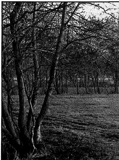
Houtwal in het Zuidelijk Westerkwartier.

Vredewold wordt gevormd door een eveneens ZW-NO lopende dekzandrug met hierop de dorpen Marum, Nuis, Niebert, Tolbert, Midwolde en Lettelbert. Tussen de beide grote zandruggen ligt nog een zandgebied met hierop Trimunt en de dorpen Opende, Kornhorn en Noordwijk. In het oosten ligt een kleiwig met het dorp Enumatil erop.