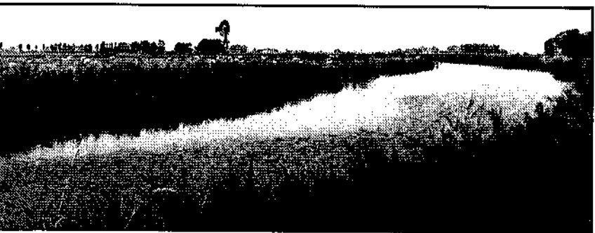
Wommels vanuit het westen. Bolswarder vaart west van Edens