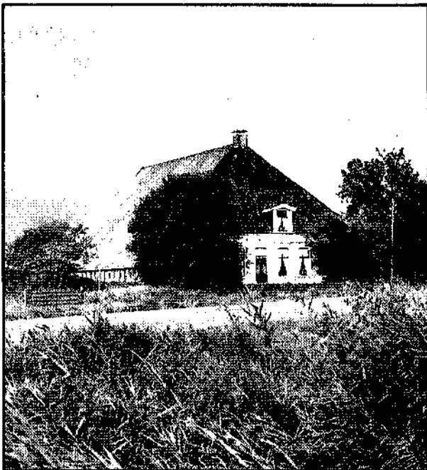
Zathe Klieuw, zuid van Hidaard

Stelpboerderij bij Edens. Kleiweidegebied tussen Wommels en Hidaard