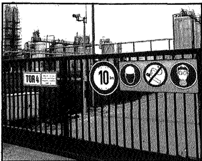
Toegangshek bij de ontzwavelingsfabriek in het Duitse Grossenkneten.

dit keer weinig moeite mee te hebben dat er weer in een kanaal chemisch afval gesignaleerd is. Sterker nog, alles wat de fabriek kan tegenhouden is welkom, zelfs gif. Ondertussen worden er voorbereidingen getroffen om op grote wijze in optocht op 26 september een petitie aan te bieden aan het gemeentebestuur. Deze petitie is ondertekend door 5000 Emmenaren en honderden randstedelingen. De laatste zijn verzameld door het VVV Emmen die elke bezoeker confronteert met de gevolgen van de fabriek.