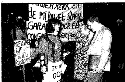
Hoorzitting te Emmen

Op pagina 4: Onduidelijkheid over gevolgen bij storingen.