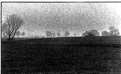
Groene wierde bij Onderwierum (21)

verwerkt zijn in een van de vele vaak vervallen steenfabrieken die we links aan de horizon zien. Tweehonderd meter na het bruggetje is de eens zo gewichtige Munsterweg niet meer begaanbaar (20), we slaan linksaf en komen via de Trekweg (blijkbaar voeren hier vroeger trekschuiten) langs het Winsummerdiep in Onderdendam. Hier slaan we direkt rechtsaf. Aan de rechterhorizon is nu met enige moeite een lichte glooiing zichtbaar: het gehuchtje Onderwierum (21). Het bestaat uit een lang-