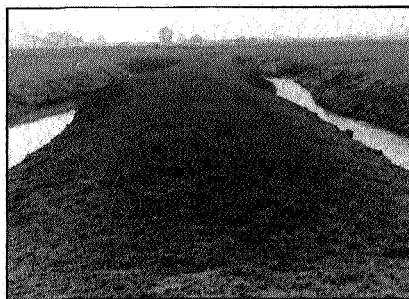
De verborgen Munnikeweg (26). Dit spoor der monniken zal door de ruilverkaveling worden uitgewist

waar de dijk in 1573 is doorgebroken. Na de doorbraak ontstond er een waterplas of wiel, waar de herstelde dijk omheen gelegd werd. Een kleine kilometer zuidwaarts slaan we rechtsaf en komen op de Munnikeweg (het eerste gedeelte heet Pijpsterweg, 25). Vanaf de 13e eeuw trokken hierlangs de monniken (vandaar de nam van de weg) om in het gebied ten oosten van de Wolddijk het land te verkavelen. De Munnikeweg is inmiddels geasfalteerd, maar ten westen van de weg Groningen-Winsum ligt, in het grasland verborgen, het eerste deel van de Munnikeweg (26). Vanaf de Munnikeweg hebben we een