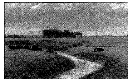
De doorbraakgeul bij Tijum (17)

We keren terug naar de provinciale weg en voordat we in Winsum arriveren passeren we de wierden Valcum (afgegraven) en Tijum (gaaf bewaard). Zeer interessant is de kronkelende sloot die noordelijk van Tijum loopt (17). Het is één van de vele doorbraakgeulen