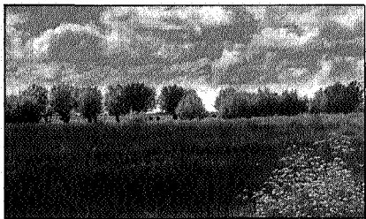
De voet van de wierde Groot Wetsinge gezien vanaf het Valgepad

bewoners zich steeds veiliger voelen, totdat een nieuw te bouwen boerderij niet meer op maar naast de oude woonplaats werd opgetrokken. De brede sloot die we hier rechts zien liggen, heeft forse oeverwallen die vooral opvallen als de sloot bij een bocht in de weg in het weiland verdwijnt (4). Volgens kenners maakte deze sloot ooit deel uit van de Drentse A. In de weilanden, ca 150 m verder, vloeit hij samen met het Selwerderdiepje (5). Vanaf die plaats stroomden Drentse A en Hunze ooit samen verder. De wierde Wierum (6) is in 1916 vrijwel geheel afgegraven. Dat wierdebewoners bij het afgraven van hun woonplaats dikwijls pas stopten als van het kerkhof de eerste doodsbeenderen naar beneden rolden, is hier wel zeer goed waarneembaar; alleen het kerkhof