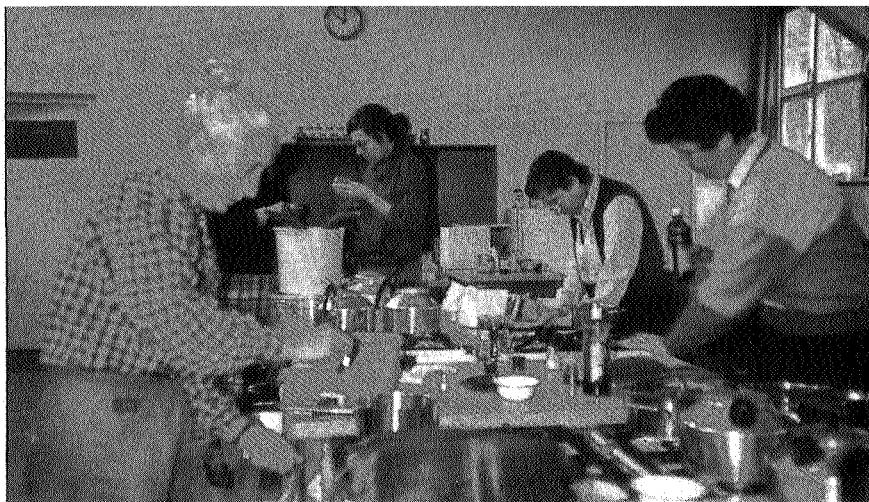
Kursus gezonde voeding

soms de noordelijke drie provincies en af en toe het hele land als doelgroep hebben. Sinds de verbouwing is er van alles mogelijk op het Natuur- en Milieucentrum. Er zijn 60 bedden, er is een conferentiezaal en twee kleinere lokalen, een grote keuken, een praktikumlokaal en een gymzaal. Tijdens de activiteiten wordt druk gebruik gemaakt van de mogelijkheden die Allardsoog en omgeving te bieden hebben. Belangrijk is natuurlijk ook de aanwezigheid van heide en bos, maar ook de sporen van de verveningen die rond Allardsoog hebben plaatsgevonden zijn erg leerzaam. Vaak worden ook bezoe-