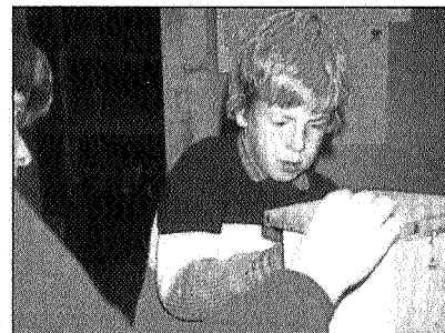
Nestkastproject op school

soms de noordelijke drie provincies en af en toe het hele land als doelgroep hebben. Sinds de verbouwing is er van alles mogelijk op het Natuur- en Milieucentrum. Er zijn 60 bedden, er is een conferentiezaal en twee kleinere lokalen, een grote keuken, een praktikumlokaal en een gymzaal. Tijdens de activiteiten wordt druk gebruik gemaakt van de mogelijkheden die Allardsoog en omgeving te bieden hebben. Belangrijk is natuurlijk ook de aanwezigheid van heide en bos, maar ook de sporen van de verveningen die rond Allardsoog hebben plaatsgevonden zijn erg leerzaam. Vaak worden ook bezoe-