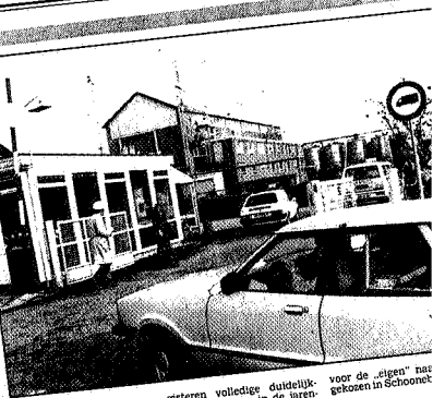
* De rijkspolitie in actie bij de poort van het Scado-bedrijf.

Ook was er een actiegroep actief in Enza, die elke gesigneerde vorm van Scado-overlast registreerde. Klachten over stankgevoelens kwamen met name uit Enza en omgeving. Vooral patiënten met astma klagen aan de luchtwegen hadden veel hinder van de chemische geur, volgens de actievoerders. Toen Scado in 1980 een aanvraag bij de gemeente Schoonebeek deed voor uitbreiding van het bedrijf, werden er meer dan vijftig bewaarders tegen de plannen ingediend. Door het treffen van allerlei technische voorontzettingen zou Scado er voor zorgen dat de overlast tot een minimum zou worden beperkt dan wel geheel zou worden weggenomen.