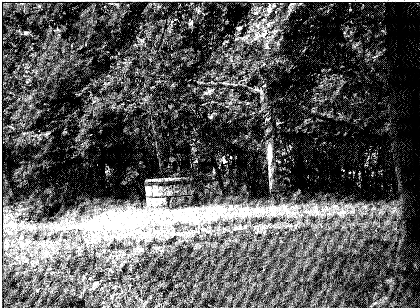
Waterput van Bentheimerzandsteen in Oostersebos