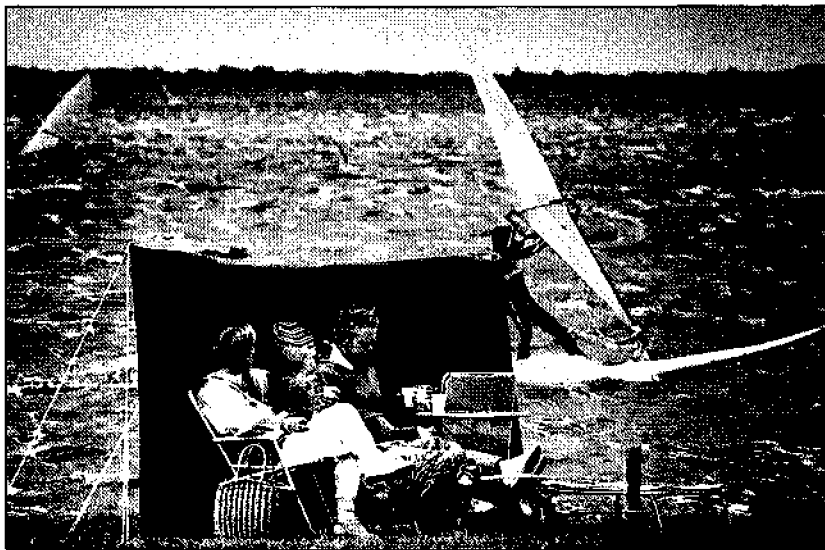
Recreatie in de Lauwersmeer bij windkrocht 18

de Lauwersmeer doorgaat, wil Muiden Chemie daar granaatvoorstuwers gaan produceren. Dit betreft een door het bedrijf verbeterde versie van een op zich al jarenlang bekend produkt. Een van een dergelijke voorstuwervoorziena granaat heeft een aanzienlijk groter bereik: in totaal zo'n 40 km. Volgens de direktie van de kruitfabriek zijn voor dit oorlogstuig de nodige orders al binnen. Het Nederlandse leger zou goed zijn voor afname van 20.000 a 30.000 stuks en ook vanuit het buitenland zou reeds de nodige belangstelling voor het nieuwe produkt zijn getoond. De granaatvoorstuwervoorziena o.m. toegepast kunnen worden bij houwitsergranaten voorzien van een neutronenkop. Gezien de afstand waarmee de granaat dankzij de voorstuwervoorziena kan worden weggeschoten lijkt een dergelijke toepassing voor de hand te liggen—het leidt tot meer veiligheid voor de schutters. De voorstuwervoorziena verder, gecombineerd met een moderniseringspakket van het Rotterdamse bedrijf RDM en een Belgische munitiefabriek voor de verouderde M-114 houwitser waarover veel landen nog beschikken, een aantrekkelijke aanbieding vormen als voor het betreffende geschut inderdaad een atoomtaak is weggelegd.