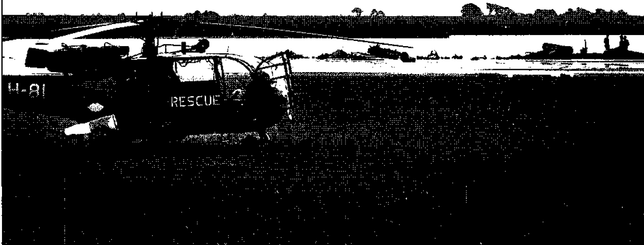
Neergestorte F16 in de Lauwersmeer

Als de voorgenomen uitbreiding van de kruitfabriek in