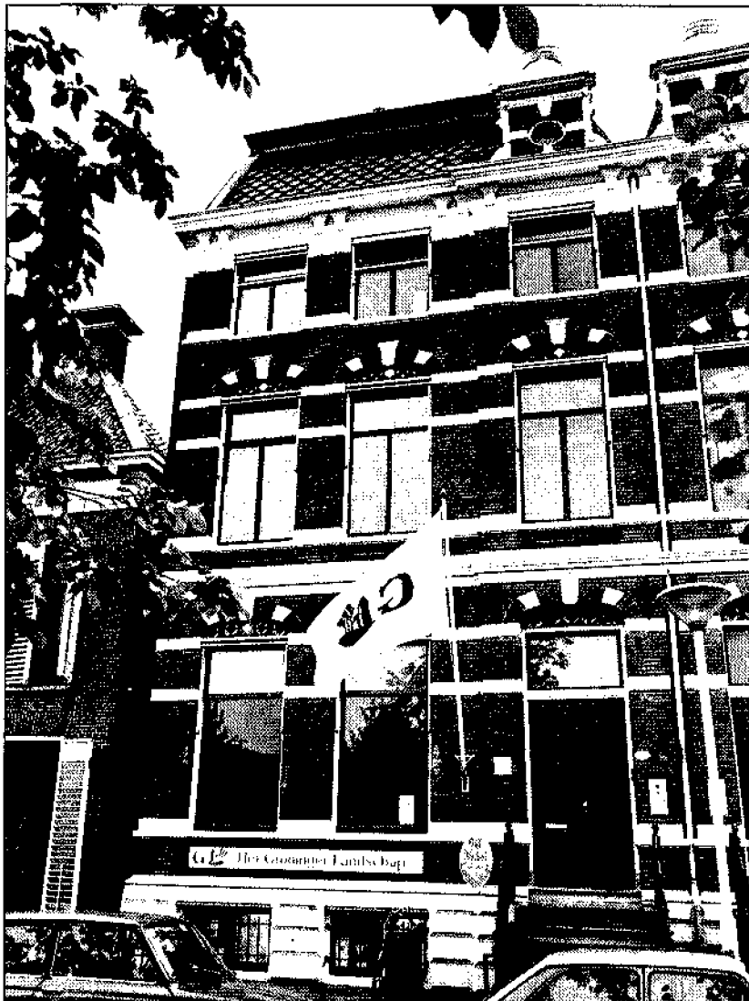
Pand van Het Groninger Landschap, de bovenste verdieping is verhuurd aan Noorderbreedte

In de tijd dat de plannen van het Dollardkanaal speelden, stond de Rijksoverheid nog open voor argumenten. Ben je het met de stelling eens dat de huidige re-