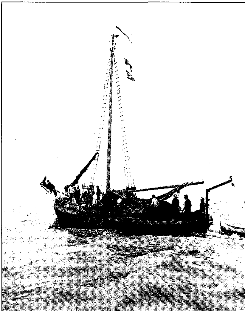
De Swarte Haen op de Waddenzee