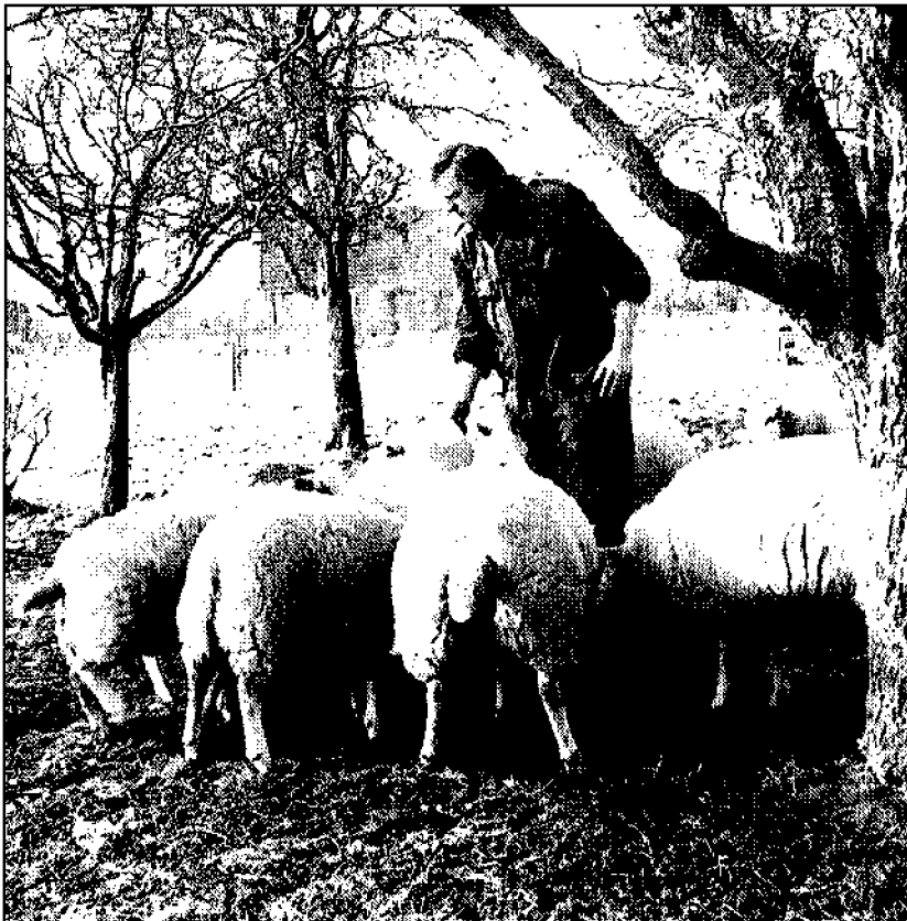
Huis van der Horst

den. Dat kan met de tent, maar de meeste mensen lopen van pensionnetje naar pensionnetje of van hotel naar hotel, en dat is hier ook heel goed mogelijk. Bed and breakfast kan ook nog. Het was dus de kunst om de route zo dicht mogelijk langs die voorzieningen te laten lopen. Daarnaast moet het ook mogelijk zijn om dagtrajekten te lopen op delen van de route. Bepaalde punten moeten dus goed bereikbaar zijn met openbaar vervoer.