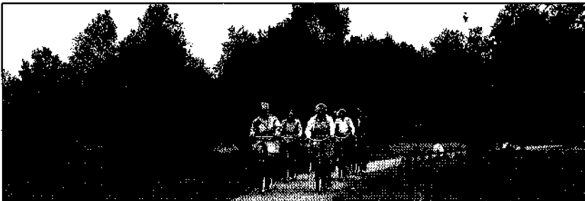
J oeneniaie wie tija beteket valakreëren