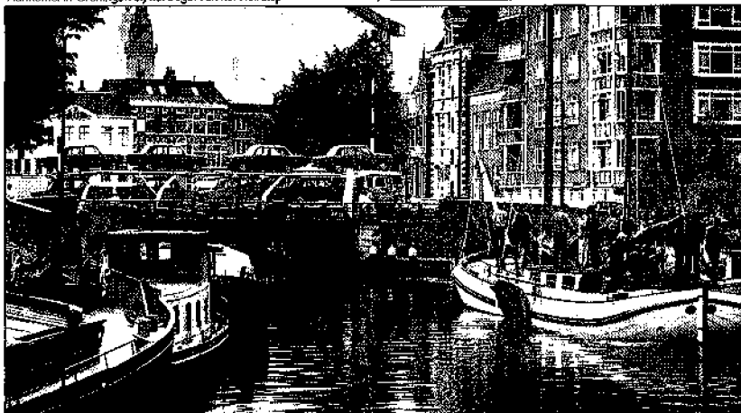
Aankomst in Groningen bij het begin van het Reitdiep

Allemaal redenen om abonnees te werven. Ook u als lezer kunt daar veel aan doen. Ook in dit nummer zitten twee opgavekaarten. Vul ze in en stuur ze op.