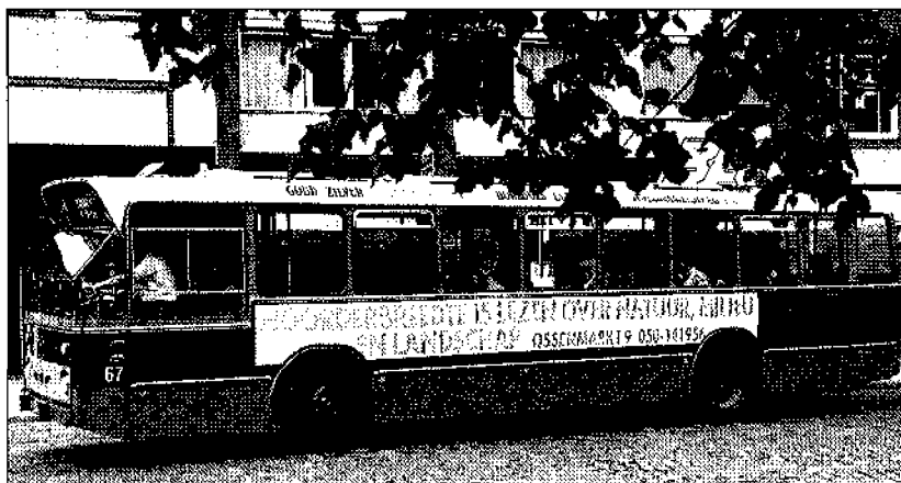
Groninger stadsbussen met eigenijdse reclame