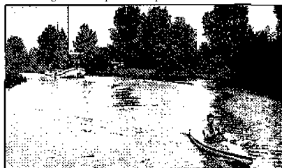
Kleinchalige recreatie op het Reitdiep