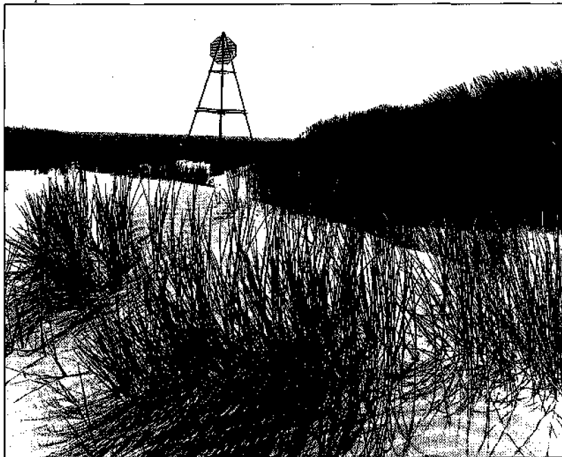
Baken op de Hon

Het eigendom omvat de Kooiuidinen, Koopolder en dat deel van het Nieuwlandsrijd en het Oerd dat niet in het bezit is van het Rijk. Iedere aandeelhouder heeft het recht jaarlijks voor elk aandeel een 'halfbeest' te weiden. Twee aandelen geven het recht om één 'volbeest' of twee 'halfbeesten' te weiden. Onder een half-