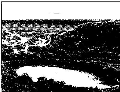
Oerdduinen met drinkklokke voor het vee, op de achtergrond de Waddenzee

Na plusminus 200 m ziet men langs de wadkant een afslagrandje. Dat wijst erop dat in dit gebied de kwel-