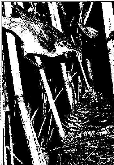
Kleine karekiet voert koelwater op

hangen aan stengels. Minstens één daarvan moet een dode, verhoutte stengel zijn. De aanwezigheid in de vegetatie van dode stengels van het voorgaande jaar is dus van groot belang.