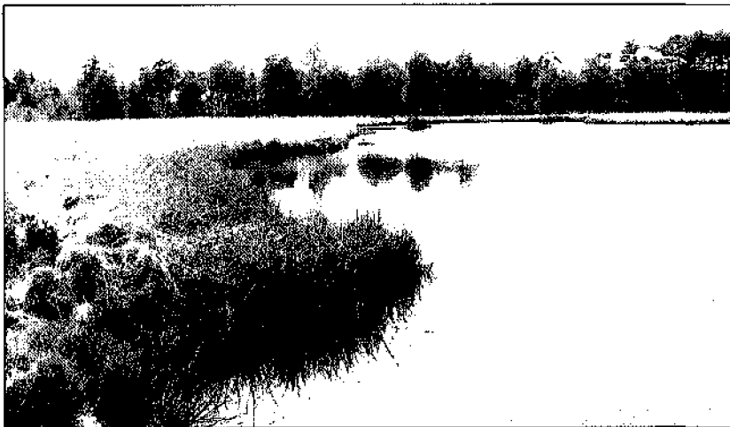
Ven aan het begin van de wandeling

Na zo'n 200 meter bevindt zich aan de linkerkant een picknicktafel en meteen daarachter de 'Meeuwenpas'. Dit prachtige ven vormt de natuurlijke voorzetting van de boswachterij Hooghalen naar het Groote Zand. Het ven ligt in een open terrein met daarin een enkele berk. Op de achtergrond een bosgebied van Japans lariks. Dit gebied is eigendom van Staatsbosbeheer en de doelstelling is om hier een productief bos in stand te houden. Dat wil zeggen dat de houtopbrengst de belangrijkste drijfveer is van dit circa 40 jaar oude bos. Het bos is na de heide-ontginningen aangelegd. Zo'n 200 m na het ven is rechts een open gedeelte zichtbaar dat lager gelegen is en dus vochtiger is. In deze open lage gedeelten is nog iets van het half-natuurlijke landschap van de vroegere bewoning zicht-