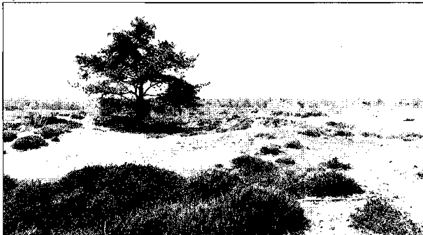
Stuifzand met heide, mossen en korsmossens

Na 300 m volgt men de wandelroute naar links. Men komt via een rooster in het schapenterrein. Er is hier een picknickplaats en op de hoek staat een tamme kastanje met 2 stammen. Meerdere van deze aangeplante bomen staan langs dit zandpad en ook naast het ven staat een kastanje. Aan de rechterkant ligt in de verte een boerderij met ligboxenstal in een ruilverkavelingsgebied. Iets ten noorden daarvan ligt het weidevogelgebied rond het gehucht Geelbroek, een gebied dat door Staatsbosbeheer beheerd wordt. Zo'n 350 meter verder komt men op een T-splitsing en gaat men links. Hier begint het eigendom van de Stichting Het Drentse Landschap. Het bos ziet er hier totaal anders uit dan in het begin van de wandeling. De begroeiing heeft hier een veel natuurlijker aanzien. De samenstelling van het bos bestaat uit vliegdend, eik, berk en onderbegroeiing van wilg en de Amerikaanse vogelkers, ook wel bospest genoemd. Deze soort overwoe-