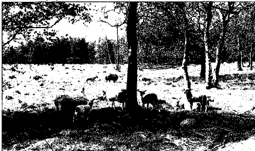
Schoonebeker heideschapen op het Groote Zand

stenen werden stukgeklopt om vervolgens als wegverharding te worden gebruikt.