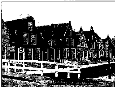
Zoutsloot in Harlingen

Het verdient aanbeveling beide hieronder beschreven trajecten per fiets af te leggen: alles valt dan rustig te bekijken en er behoeven geen halsbrekende toeren te worden uitgehaald indien op de smalle weggetjes auto's moeten worden gepasseerd. Gekozen is voor een tocht van ca. twee uren via een noordelijk van Harlingen gelegen route, en een wat langere van zo'n drie uren gaans die door het landschap ten zuiden van de stad voert.