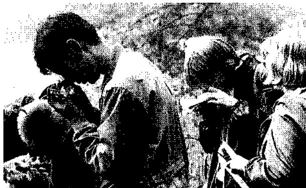
Veldwerk is een belangrijk onderdeel van natuur- en milieueducatie