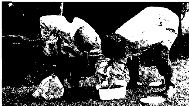
Schoolbegeleiders in actie