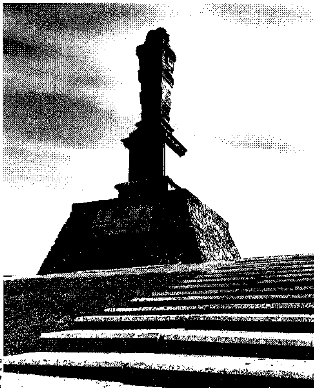
Standbeeld ter ere van Caspar di Robles op de Westerseedijk te Hartingen

In Noorderbreedte is al eerder aandacht besteed aan de bouw van zeedijken en binnendijken in Friesland; een activiteit waarmee de bewoners van dit laaggelegen gewest noodgedwongen eeuwenlang in de weer zijn geweest teneinde het hoofd (letterlijk) boven water te houden. De dijken zijn in dit wijidse landschap nog steeds markante visuele elementen, die de blik onweerstaanbaar naar zich toe trekken. Net als in de andere twee waddenprovincies Noord-Holland en Groningen bepalen zee- en binnendijken immers de grens van land en zee, ook al is die zee in veel gevallen intussen tot kilometers ver van de vroegere grenzen gebannen. Het is een Portugees edelman geweest, die de Friezen in de 16e eeuw ertoe aanzette hun laagliggend land voor verdere rampen te behoeden. Nog steeds siert zijn beeltenis, de 'Stenen Man', de zeedijk bij Hartingen.