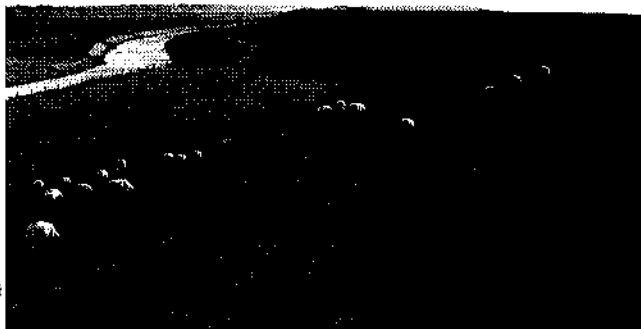
De Caspar di Roblesdijk tussen Roptazijl en Oosterbierum

van een commissie van arbiters die moest proberen de geschillen over de dijken op te lossen. Hij vatte die taak zeer serieus op en zou haar ongetwijfeld snel ten uitvoer hebben gebracht, als hij niet was weggeroepen om het opstandige Haarlem te bedwingen. Maar toen hij in 1573 terug kwam bezat di Robles de grootst mogelijke bevoegdheid dankzij zijn benoeming tot stadhouder. Op 18 oktober 1573 werd tijdens een buitengewone 'visitatiedag' de toestand van de dijken uitgebreid gecontroleerd. Gekonstateerd werd oa. dat een groot gedeelte bij Harlingen dermate was weggeslagen dat een geheel nieuw stuk dijk tot stand moest komen. De nieuwe dijk moest 10 à 12 voet hoog worden, zo werd bepaald, ook de gedeelten die