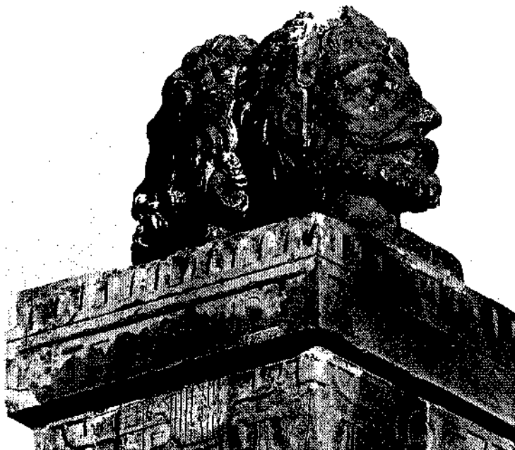
De enkele malen vernieuwde Januskop van di Robles. Het Latijnse Terminus staat voor grens

nog konden worden hersteld. Een maand later werd het besluit afgekondigd over de verdeling van de verantwoordelijkheid en lasten tussen binnen- en bûtendyksters. De grens zou net ten zuiden van Harlingen komen. Daarmee werd in feite ook de plaats bepaald waar later het standbeeld voor di Robles zou worden opgericht. Na de winter van 1573-'74, waarbij opnieuw overstromingen en — jawel — nieuwe twisten over de afgekondigde besluiten optraden, werd het werk dan eindelijk ter hand genomen.