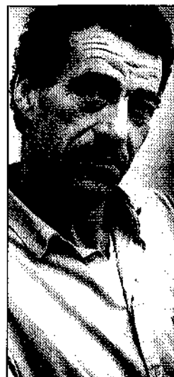
Tentoonstelling van Tiddo Nieboer in het Groninger Museum