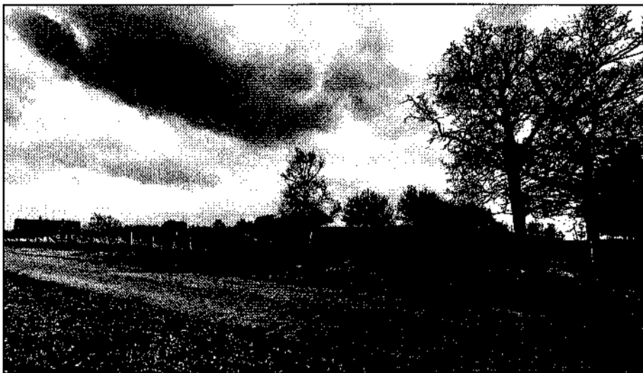
De Hasseberg vanuit het zuidwesten gezien

Op de grens van Groningen en Duitsland ligt een kaal, vlak en stil gebied. Niemandslaan — nog maar zeventig jaren geleden tevoorschijn gespit onder enige meters veen vandaan. Een landschap van akkers waarop een aantal landbouwers hun AVEBE-bestaan zo lang mogelijk proberen te rekken. Wie zich vanaf Bourtange langs de grens naar het Zuiden begeeft, stuit tot zijn verbazing op de Hasseberg. Weinigen zullen dit hoogste natuurlijke punt van de provincie Groningen (14,6 m + NAP) kennen.