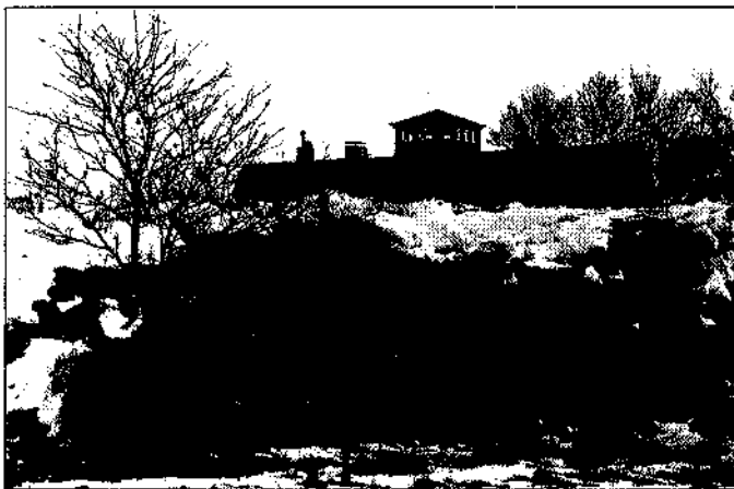
Het markante uitkijktorentje met op de voorgrond een keiteemoand

een lichte knik van Bourtange naar Ter Apel. Op de Hasseberg staat sinds 1824 de grenspaal nr 176.