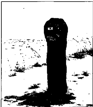
Grenspaal nr. 176 staat sinds 1824 op de Hasseberg

granen en eens in de drie jaren een seizoen van braakliggen.