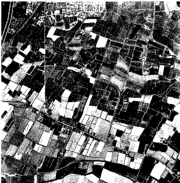
Luchtfoto van het Hogewiersterveld, linksboven Harlingen