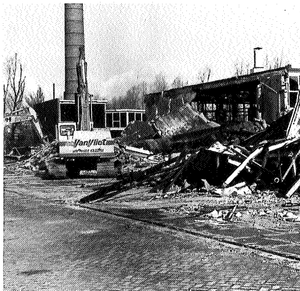
Stalen onderdelen worden verwijderd