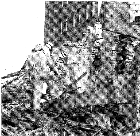
Personeel van Van Vliet zoekt in 'maanpakken' naar chemisch afval