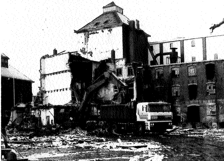
Vervoer van het puin