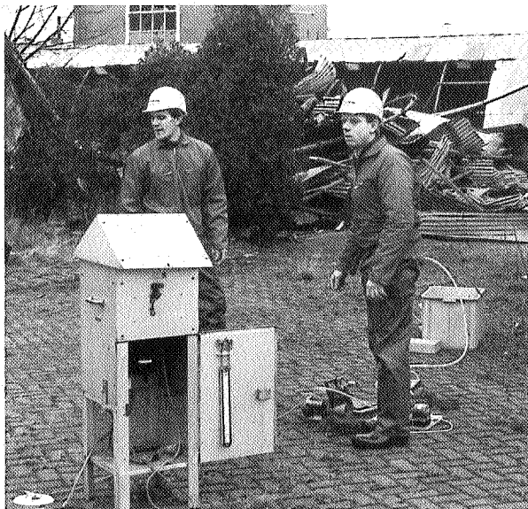
Stofmeting door Iwaco