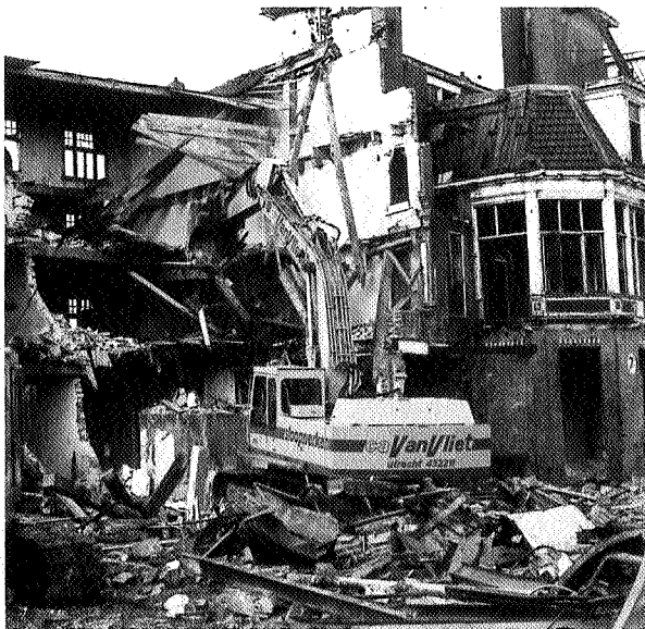
Sloop van de gebouwen