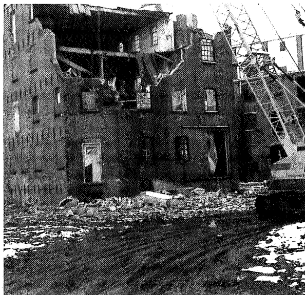
Met een ijzeren kogel van 800 kg worden de muren geramd van gebouw 7