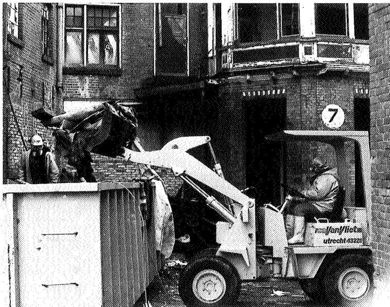
Schoonmaken van de gebouwen