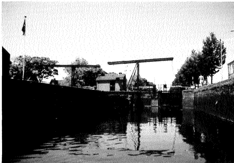
Vijfdeverlaat te Musselkanaal

Oude muren herbergen soms een unieke flora. Zo liggen in de gemeente Stadskanaal twee sluiskomplexen, waarop voor Nederland zeldzaam voorkomende plantesoorten (kunnen) groeien. Een te grondige restauratie, gebruik van (on)kruidverdelgingsmiddelen enz. kunnen fatale gevolgen hebben voor de begroeiing. Dit artikel is een pleidooi voor een juist beheer tot behoud van 'paradijsjes op muren' en geheel gebaseerd op een rapport van A. J. en H. Dijkstra.