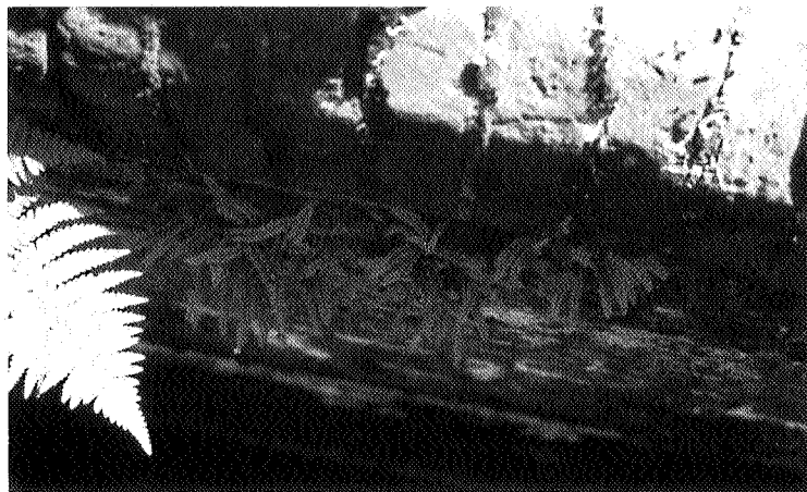
Groensteelvearen op de Buinersluis

Hopelijk leidt dit artikel er toe dat instanties en particulieren die oude muren hebben te herstellen eerst (laten) nagaan of deze een waardevolle flora bezitten of de mogelijkheid hebben die te verkrijgen. ●