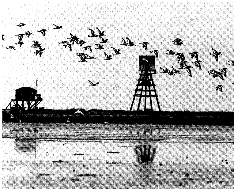
Scholeksters op Griend, met vogelwachtershuisje en bakken

HET EILANDJE IS EIGENDOM VAN NATUURMONUMENTEN en is verboden terrein voor recreanten. Dat was rond 1900 wel anders, toen vissers en wadschippers er in de broedtijd aanlegden om een 'eierstruif' te bakken, en men wist zelfs te melden dat grote tjalken met 100 passagiers, een muziekkorps, 8 kruiken jenever en 120 flesjes bier uitvoeren voor een vakantietripje naar Griend in de broedtijd. Sinds 1912 is daar een stokje voor gestoken, aanvankelijk door veldwachter H. de Haan van Terschelling op wiens initiatief twee bewakers op Griend werden gestationeerd tijdens het broedseizoen.