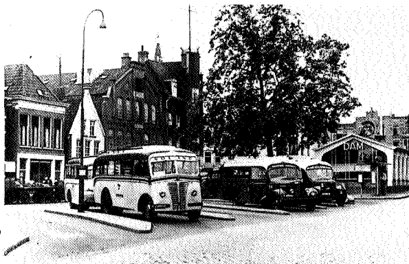
Het busstation op het Damsterdiep in Groningen rond 1950

Assen en op 4 plaatsen in Winschoten. Sinds 1986 is het Noordelijk Bus Museum gevestigd in een oude remise van de GADO in Winschoten. Deze remise heeft 2 sporen voor onderhoud en reparatie, 6 sporen voor het stallen van 7 bussen en een ontvangstruimte. Maar het is te klein, de andere 9 bussen zijn gestald in Drachten en op een andere plek in Winschoten. Geert Talsma is al meer dan een jaar bezig om in Winschoten een nieuw onderkomen te krijgen. Met B&W zijn contacten gelegd om een dergelijk museum (het enige in Winschoten) te realiseren. Het zou een overdekte ruimte moeten worden van minimaal 2 ha en extra ruimte voor parkeergelegenheid, omdat er belangstelling bestaat om het Bus Museum in een dagtochtenprogramma op te nemen. Daarnaast heeft het