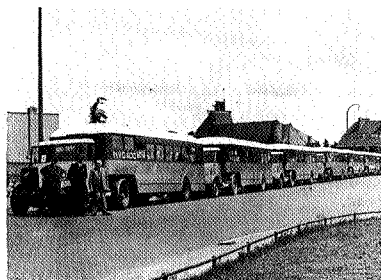
Crossley trekkers met oplegger uit 1946

Onder auspiciën van het museum wordt ook een serie boeken uitgegeven over maatschappijen die niet meer bestaan. Inmiddels is het