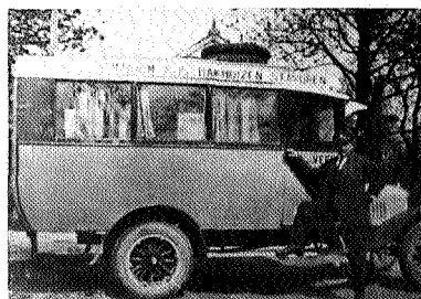
Vroegere busdienst Balk-Stavoren