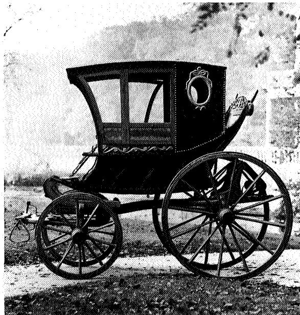
Zuidbevelandse kapwagen van protestants type

De Kiereboe van Rutger Jan Schimmelpenninck werd in 1934 aan de oudheidskamer geschonken door Graaf Schimmelpenninck van