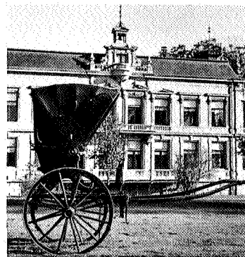
Friese tilbury sjees

Het Nationaal rijtuigenmuseum is geopend van 1 april tot 1 oktober en heeft jaarlijks wisselende tentoonstellingen zodat telkens een ander deel van de verzameling aandacht krijgt, want de hele kollektie staat niet permanent opgesteld. ●