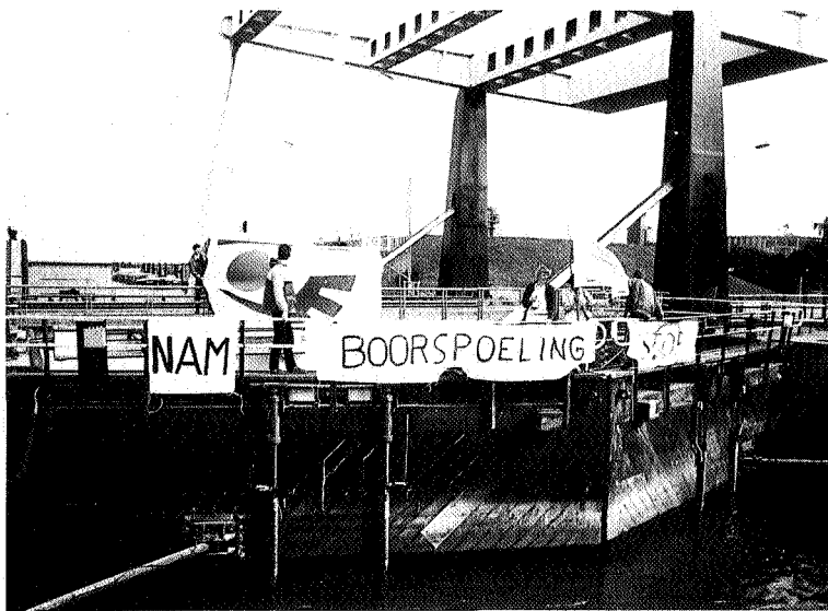
Aktie boorspoeling NAM

Ludieke acties werden er uiteraard ook gevoerd. In 1983 boden we, in optocht door Delfzijl trekkend, PCB-moleculen aan aan de wethouder van die gemeente. Een jaar later 'veroverden' we, verkleed als geuzen en onder luid klaoengeschal, vanaf een tjalk op de Eems, het centrum van Emden. Deze actie was mede opgezet door onze milieuvrienden aan de Duitse zijde en was bedoeld als protest tegen de voorgenomen aanleg van de Dollarthafen bij Emden. Enkele jaren daarvoor, in 1981, hadden we voor hetzelfde doel en met dezelfde aktievoerders, al zes hele weken op een zogenaamde 'dreibein' vertoefd. Een 'driepootruiter' die stond opgesteld in het omstreden grens-gebied in de Dollard. Het Dollarthafenproject heeft naast ludieke acties ook erg veel juridisch werk, politiek overleg, voorlichting en publiciteit gekost. Bovendien hebben we, samen met andere natuurbeschermingsorganisaties, alternatieven uitgewerkt die heel goed zijn ontvangen. En