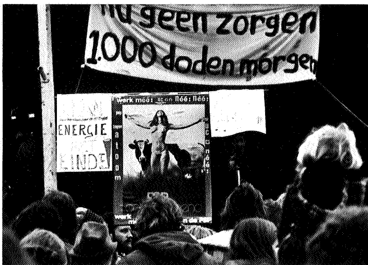
Anti Atoomdemonstratie te Onstwedde in 1977

was. Dit tot ongenoegen van de provincie Groningen die dat maar hinderlijk vond voor de industrialisatieplannen.