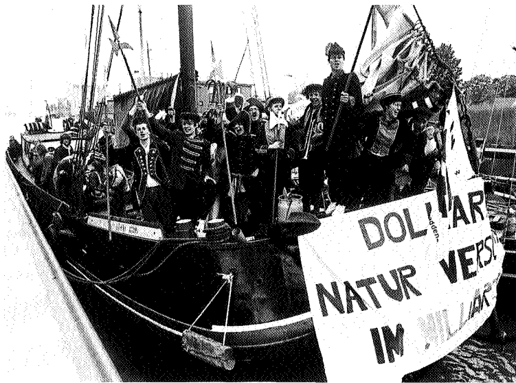
Geuzenaktie te Emden

AKZO is nog een zeer actueel actieonderwerp van de Werkgroep Eemsmoond. Naast de direkte actie tegen het bedrijf is voor ons ook de strijd tegen een bedrijfsvriendelijke provinciale politiek van groot belang. De lankmoedige houding van de provincie heeft een precedentscheppende werking. Nieuwe bedrijven vestigden zich ook in Delfzijl. In 1987 kwam Ventrox, dochter van Morton Thiokol , een fabriek voor bleekmiddel