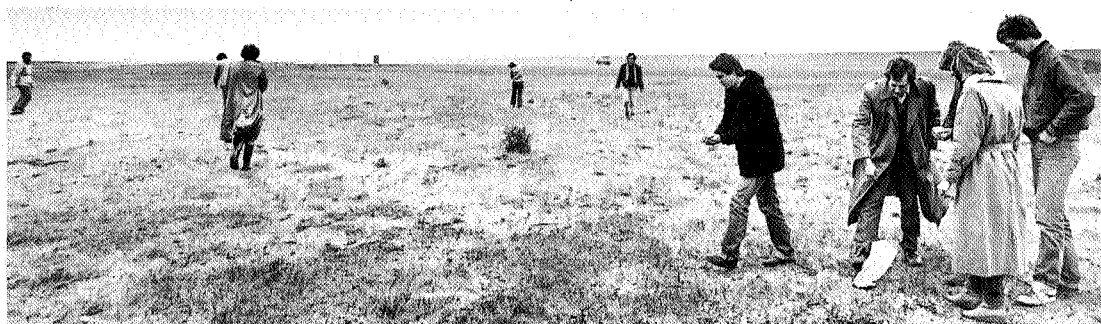
Inzaaien van papavers in de Eemshavenvlakte in 1981

Het voorgaande overziende blijven bij ons één vraag en één konklusie over: hoe hebben we zoveel problemen in hemelsnaam al die 15 jaar aangekund en we zullen zeker nog eens 15 jaar door moeten gaan, willen het beleid en de werkelijkheid enigszins gaan lijken op hetgeen ons voorstaat bij behoud en bescherming van het zo prachtige en onvervangbare Eems-Dollard estuarium. ●