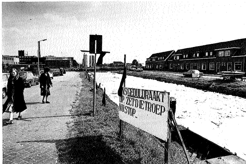
Sterke waterverontreiniging tijdens de aardappelmeelkampagne in Veendam, 1979

havengebied, het veenkoloniaal afvalwater, de aanleg van de Duitse Dollarthafen en atoomenergieplannen speelden, ontstond de behoefte aan een moderne, deskundige en slagvaardige actiegroep. De Waddenvereniging nam begin 1974 het initiatief tot zo'n werkgroep en stelde een vaste medewerker, en later ook een jurist, en het sekretariaat in Harlingen er gedeeltelijk voor vrij. Verder namen andere natuur- en milieuorganisaties