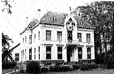
Wandelen in de gemeente Ezinge