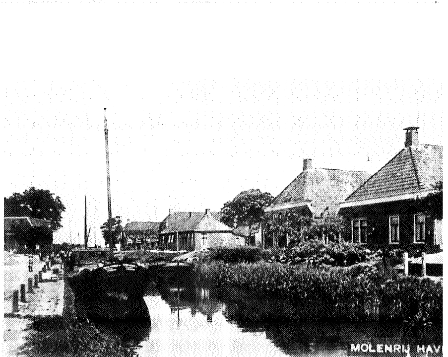
Het havenje van Molenrij omstreeks 1900 (Struunroute Kloosterburen).