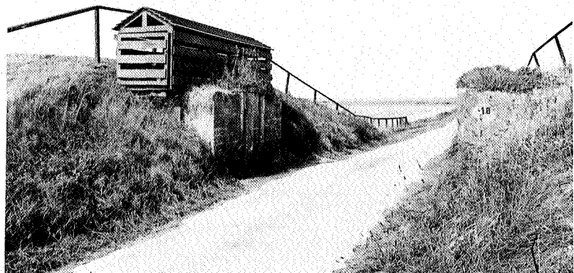
Dijkdoorgang Hornhuizen (route Kloosterburen).

De belangstelling voor de Struunroutes is tot dusver goed te noemen. De eerste route verscheen in de zomer van 1989 en de andere kwamen in het najaar en in de winter op de markt. Een op stapel staande publiciteitscampagne moet het bestaan van de routes nog iets meer bekendheid geven, waardoor nog meer wandelaars, gewapend met een Struunroute, het Groninger land zullen ontdekken. De boekjes zijn onder meer verkrijgbaar bij VVV kantoren, de plaatselijke horeca en een aantal boekhandels. De verkoopprijs bedraagt f 3,95. ●