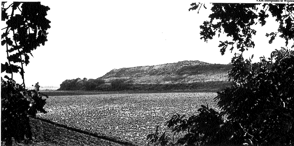
VAM stortplaats te Wijster

Reinder Hoekstra is beleidsmedewerker afval bij de Milieuraad Drenthe.