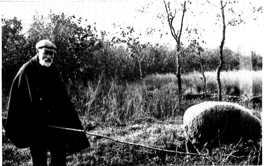
Jarig van der Wielen

Op de grens van drie provincies en een vijftal gemeenten ligt het buurtschap Allardsoog. Verspreid in het landschap bevinden zich een aantal woningen, boerderijen, schuren, een café met een camping en de gebouwen van de Volkshogeschool op een terrein met veel bos. Ten westen van dat bos ligt nog een gebouw dat uitkijkt over de landbouwgronden. Sinds 1979 is dit een centrum voor natuur- en milieu-educatie en al weer 7 jaar een Natuurvriendenhuis. Na een periode van meer dan tien jaar wordt nu het natuur- en milieu-educatiewerk ondergebracht bij de Volkshogeschool, die een eindje verderop ligt.