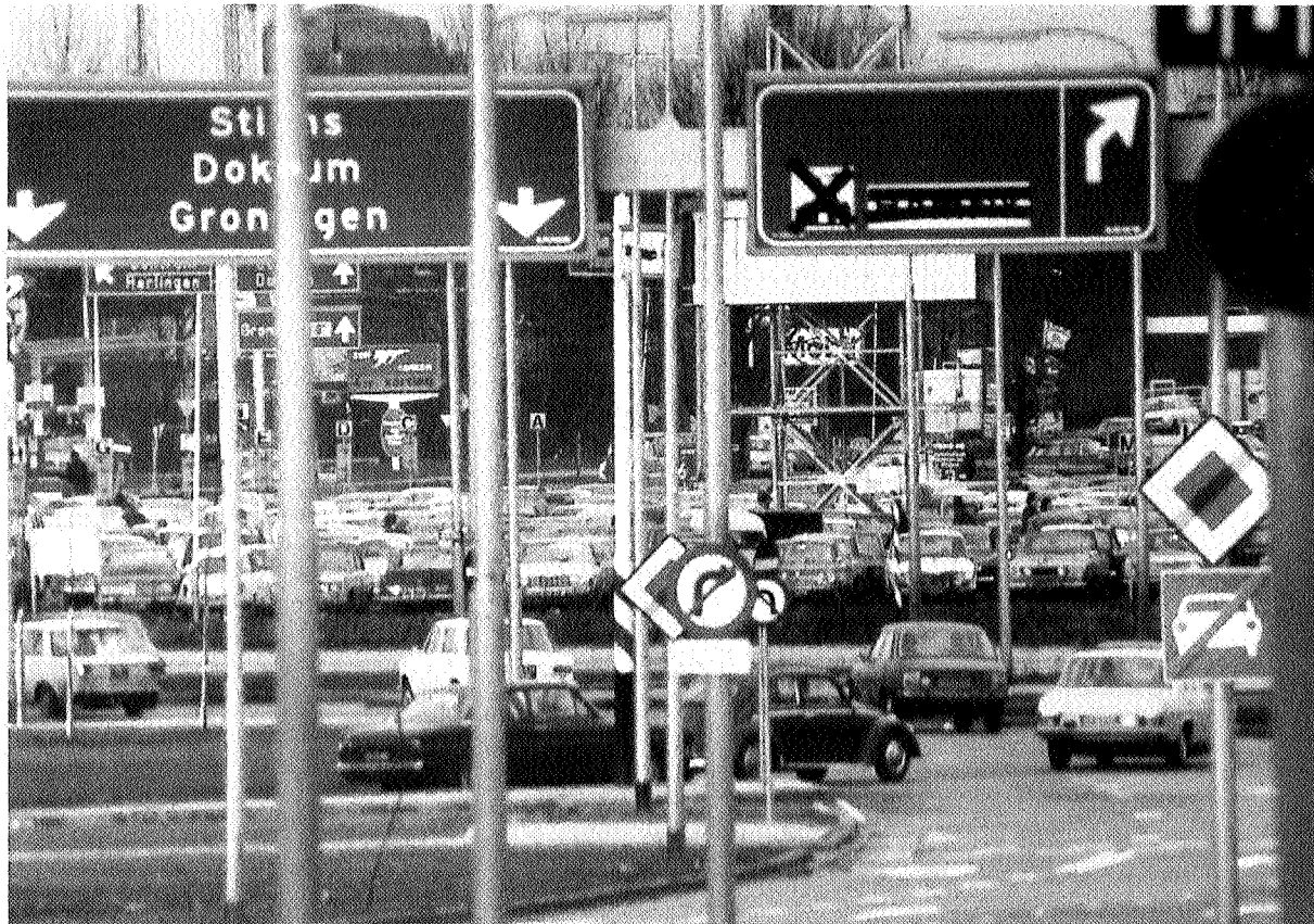
Filevorming in Leeuwarden