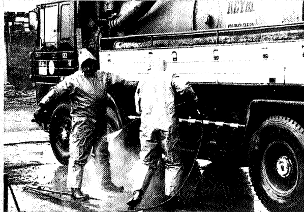
Sanerders spuiten elkaar schoon na het betreden van een verontreinigde lokatie.

Bodemverontreiniging komt in heel Nederland voor. Het beleid van de rijksoverheid is bepalend voor de aanpak van het probleem. Er zijn in de afgelopen jaren veel verschillende plannen gemaakt om de bodem te saneren. Tot nu toe is slechts een fractie van het aantal vervuilde plekken gesaneerd. Met duidelijker rijksbeleid en konkretere wetgeving zullen de problemen moeten worden bestreden.