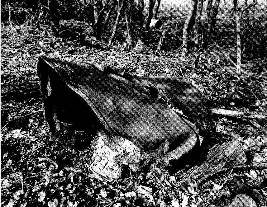
Gifbelt Paddepoelsterweg Groningen.