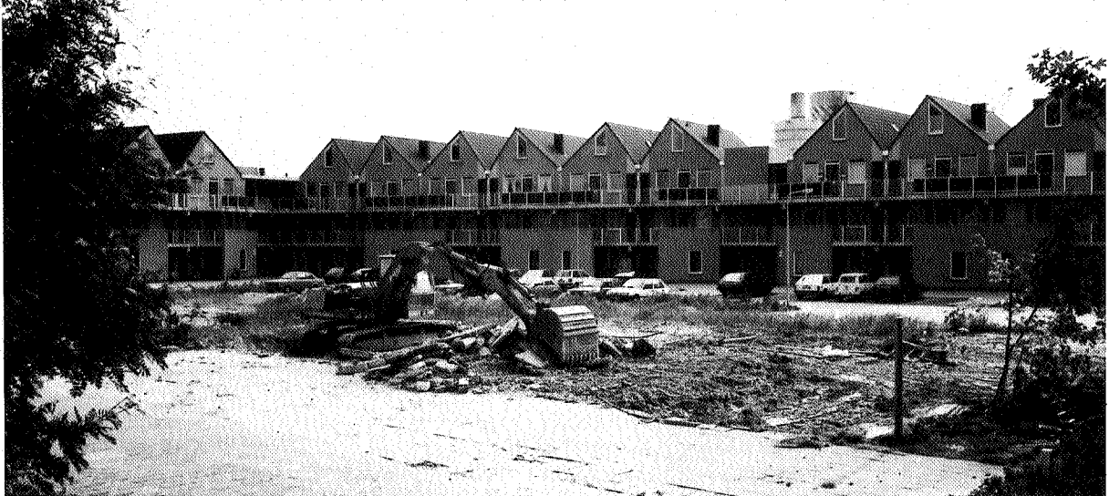
Woningbouw op voormalig bedrijfsterein Zondervan, Sneek.