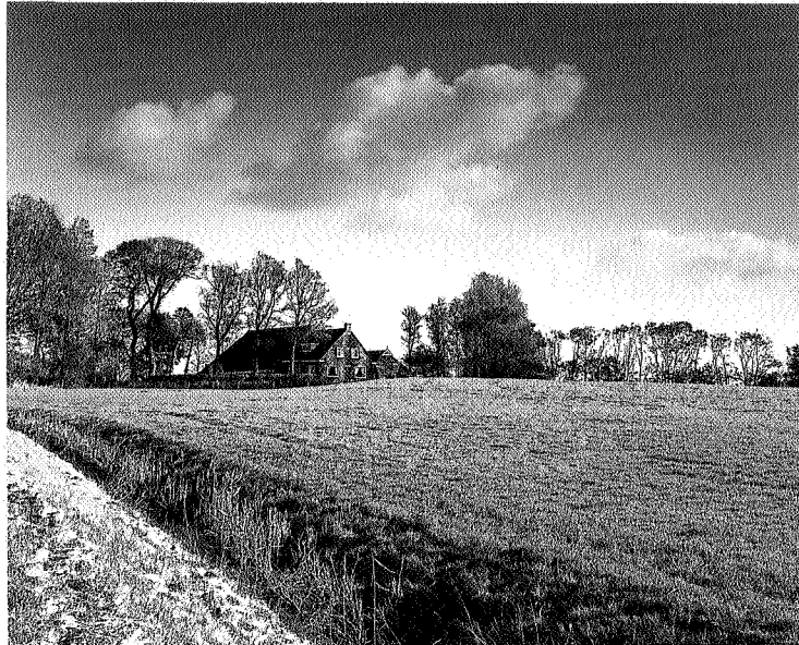
Landschap nabij Den Ham.