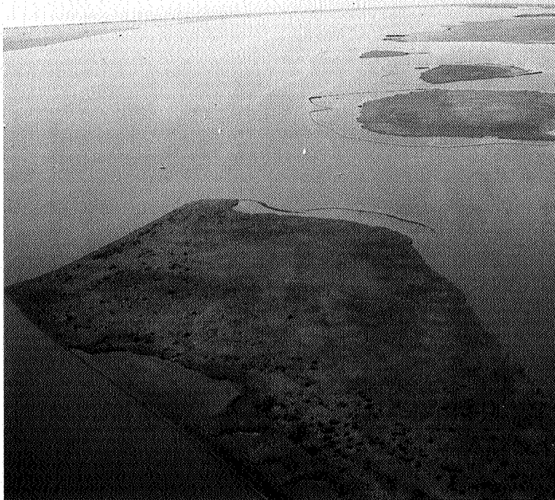
Lauwersmeer en Waddenzee; internationaal erkende natuurgebieden.

overleg- en samenwerkingsstructuur met bedrijven, landbouw, gemeenten, milieu-organisaties en waterschappen, waarbij in een sfeer van openheid van gedachten wordt gewisseld en naar oplossingen wordt gezocht. Nog voor de zomer denkt de provincie daardoor een structuur gereed te hebben.