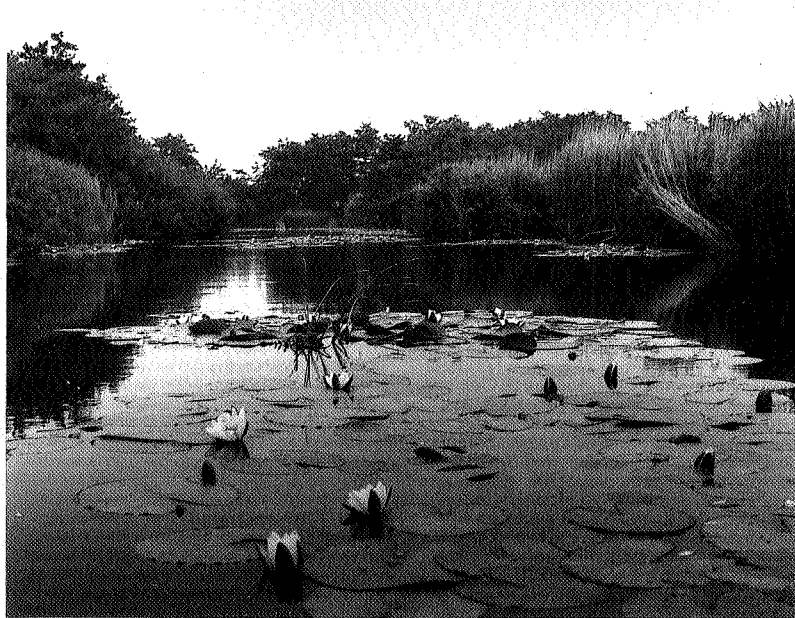
De Alde Feanen