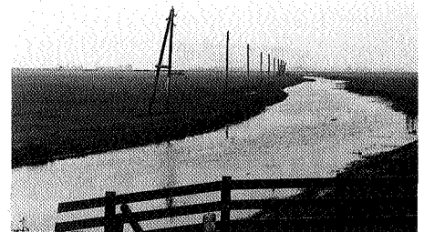
Telefoonpalen naar gemaaltje Oudega

Langs de Feandyk gaan we naar het gemaaltje 'Van der Meer' op de hoek van de afslag naar Idzega. Halverwege de Feandyk kijken we even terug naar het gemaaltje 'Gaastmeer' dat vanuit deze positie een markante en horizonbepalende plaats inneemt in het overigens vlakke landschap. We slaan af richting Idzega waar aan het eind van de doodlopende weg (!) een klokkestoel (1980) de grafheuvel siert die grenst aan het Kerkehop, een uitloper van de Idzegaasterpoel. Een grafsteen uit 1591 verraadt de veilige charme in dit weidse gebied tussen land en water. (5) We rijden terug over de Klokhúdyk naar de Feandyk richting Oudega en treffen opnieuw een dubbel gemaaltje 'de Band' aan, links van de weg in de eerstvolgende bocht. Zoveel houten hekwerk als hier het gemaaltje omringt vinden we nergens. De opvoerhoogte tussen boezem-