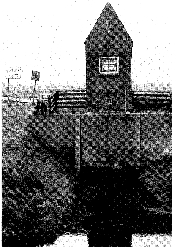
Gemaaltje Van der Meer

Joure-Lemmer-Workum. Onze fietsroute ligt in het tweede gebied en beschrijft 13 gemaaltjes van de 44 in de gemeente Wymbritseradeel en ongeveer 125 in Friesland.