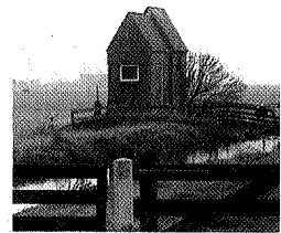
Gemaaltje De Band

Wie regelmatig door het Friese landschap dwaalt komt die aardige stramme zadeldakhuisjes tegen. Het zijn elektrische gemaaltjes, de opvolgers van de waterwindmolens. Aangezien er in de gemeente Wymbritseradeel talrijke fraaie voorbeelden zijn te vinden, hebben we een selectie samengesteld op de route Heeg-Gaastmeer-Oudega-Heeg. Een fietstocht van enkele uren voert u langs 13 gemaaltjes, waarvan 5 met de zo sfeerbepalende bovengrondse energietoevoer via 'telefoonpalen'. Deze gemaaltjes staan op het punt te verdwijnen uit het landschap. De Landinrichtingskommissie te Bolsward heeft een 'Ontwerpplan Ruilverkaveling Wymbritseradeel' samengesteld die voorziet in 19 nieuwe gemaaltjes. We spraken met de sekretaris van de commissie en enige medewerkers van het Waterschap 'Middelsékrite' te Sneek. Naast een fietsroute zijn in dit verhaal enige achtergronden opgenomen omtrent de waterhuishouding en het landschappelijke element van de gemaaltjes. Leidraad is de schoonheid van de bejaarde bouwwerkjes die nu nog zijn te bezichtigen.