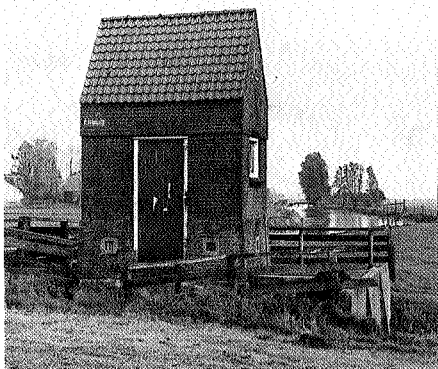
Gemaaltje en boezemvaart naar Idzega

waarin tongen en hammen hingen ter opluistering van feestdagen, voorwaarde was wel dat er hout, turf en briketten in de keukenkachel werden gestookt.